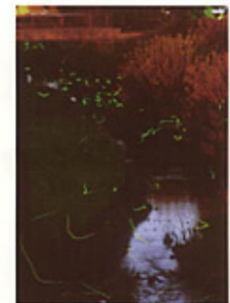
いわふね総合運動公園内 谷田川のホテル